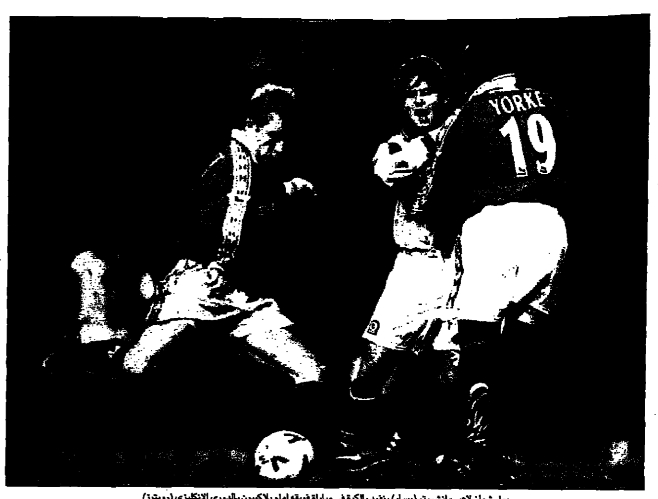
بول سولز لاعب مانشستر (يسار) يقدر بالكرة في مباراة فريقه امام بلاكبيرن بالدوري الانكليزي